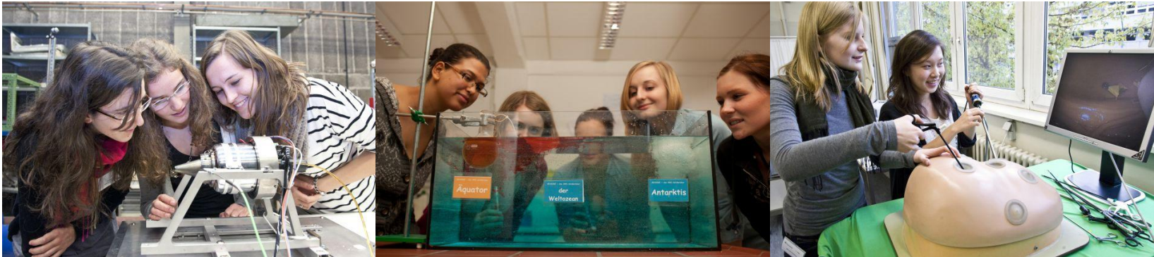
Ort: Alfred-Wegener-Institut Bremerhaven

Ein Projekt von Femtec.GmbH und LIFE e.V.